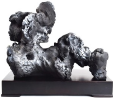
趙夢 《字母石，M》 2018 年 無釉陶瓷 37 x 22 x 17 cm