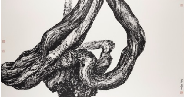
王滿晟 《古藤草書勢》（「心」） 2017 年 水墨宣紙 97 x 179 cm