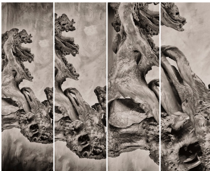
丹尼爾·埃斯肯納茨,《Synoptikos I》, 2019 年